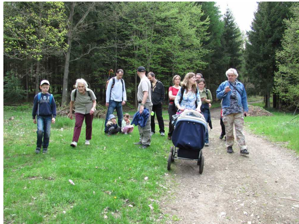
Na výletě v Brdech