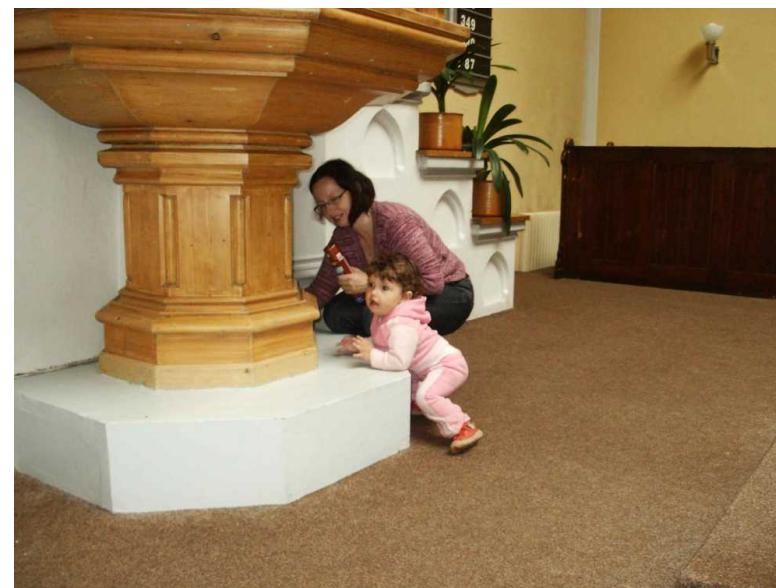
Leštila se i kazatalna