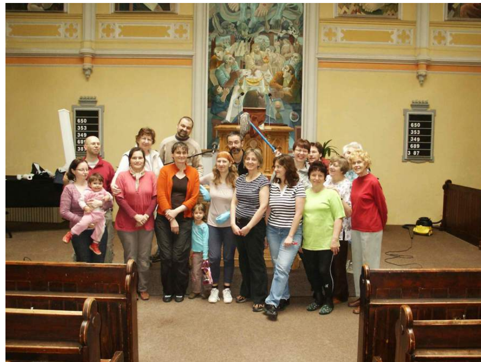
Při jarním úklidu kostela se uklízelo opravdu všechno

Případné změny v programu po uzávěrce Hroznu lze najít na sborových webových stránkách http://vinohrady.evangnet.cz , které jsou pravidelně aktualizovány.