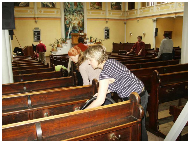
Luxovalo se pod lavicemi