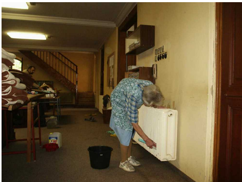
Čistilo se topení

si: na počátku byl strach, jestli je Pán Bůh s nimi. Všichni si dobře pamatujeme to vyprávění o Mojžíšově hněvivé reakci, o rozbitých deskách a o rozdrčeném teleti. Stojí ale také za přečtení (Ex 32–34), jak pracně a opakovaně se při tom všem Mojžíš za svůj lid přimlouvá. Odmítá nabídku, že by napříště Hospodin skoncoval s Izraelem a vybuodoval si nový lid z Mojžíše a jeho potomků. Na počátku byla nejistota, jestli je Hospodin s námi. Právě o Boží blízkost má nakonec lid přijít. Bůh se nechává oblomit, lid nevyhladí, dokončí s ním započatou cestu a přivede ho do zaslíbené země. Stín zklamání, puklina narušeného vztahu ale dál trvá. Mojžíš má lid uvést, jak zaslíbeno, „do země oplývající mlékem a medem?“ „Já sám však,“ pokračuje Hospodin, „nepotáhnu v tvém středu, protože jste lid tvrdé šíje, abych tě na cestě nemusel zahubit.“ (Ex 33,3)