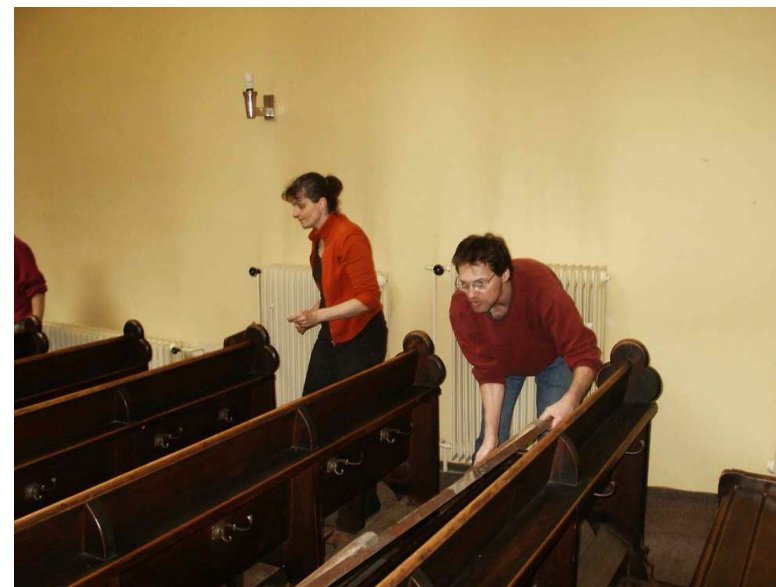
Sundávaly a myly se podlážky

Začalo to tím, že po čtyřiceti dnech od doby, kdy Mojžíše odcházejícího na horu Sinaj (Ex 24,18) zahalil oblak, Izraelci znejistěli. Mojžíš nikde a oni by chtěli boha, který by šel na jejich pouti před nimi. Povolali Árona, aby vyrobil zlaté tele, obraz, který by jim zaručil, že tady a teď je s nimi Pán Bůh. Od nedělní školy si v kostele vykládáme, že to bylo špatně, když tak brzy odpadli k jiným bohům. Bližší čtení ovšem ukáže, že v Áronově podání to měl být obraz Hospodinův. A slavnost, kterou před ním uspořádal, byla také slavností Hospodinovou. Izraelci toužili po jistotě, že jde Pán Bůh s nimi. Áron jim nabídl něco hmatatelného a viditelného, o co se budou moci opřít ve své nejistotě. Lepší něco než nic, mysleli si možná někteří, když slyšeli že toto zobrazení rohatého čtyřnožce je Hospodin, který je vyvedl ze země egyptské, z domu služby. Připomeňme