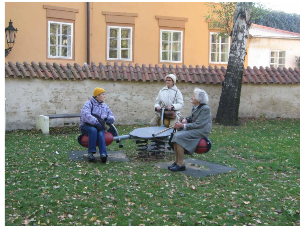
Na hřišti v Novém Světě