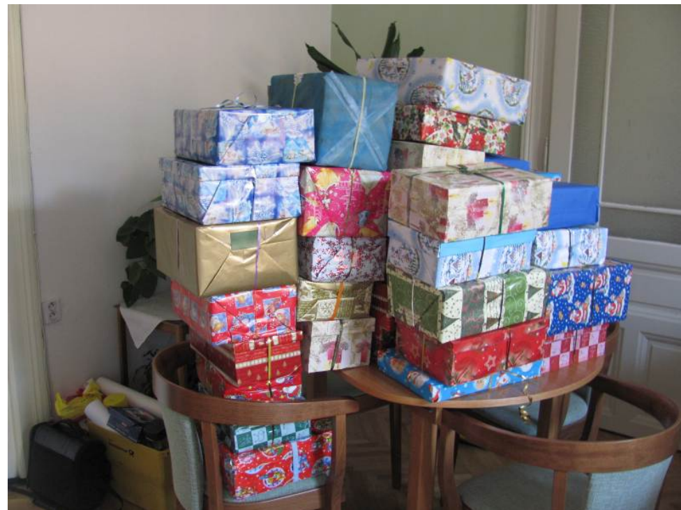
Krabice už jsou v Bohemce