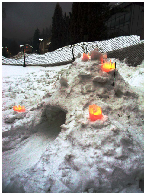
Osvětlený sněhový hrad

S diktafonem se mezi účastníky letošního pobytu vypravili dětští reportéři, aby se zeptali na dvě otázky: