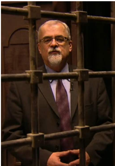
Fotografie z pořadu Novoroční sváteční slovo 2011

V současné době občas dochází do vazební věznice v Praze, ale pokud vím, působil jsi již ve více nápravných zařízeních. V čem taková práce spočívá?