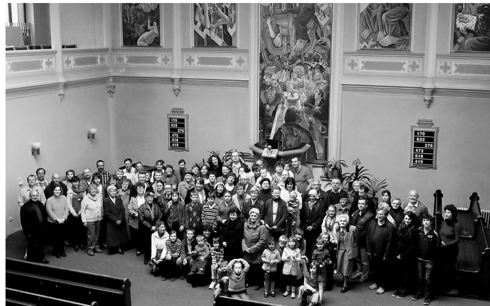
Po nedělních bohoslužbách

Případné změny v programu po uzávěrce Hroznu lze najít na sborových webových stránkách http://vinohrady.evangelnet.cz , které jsou pravidelně aktualizovány.