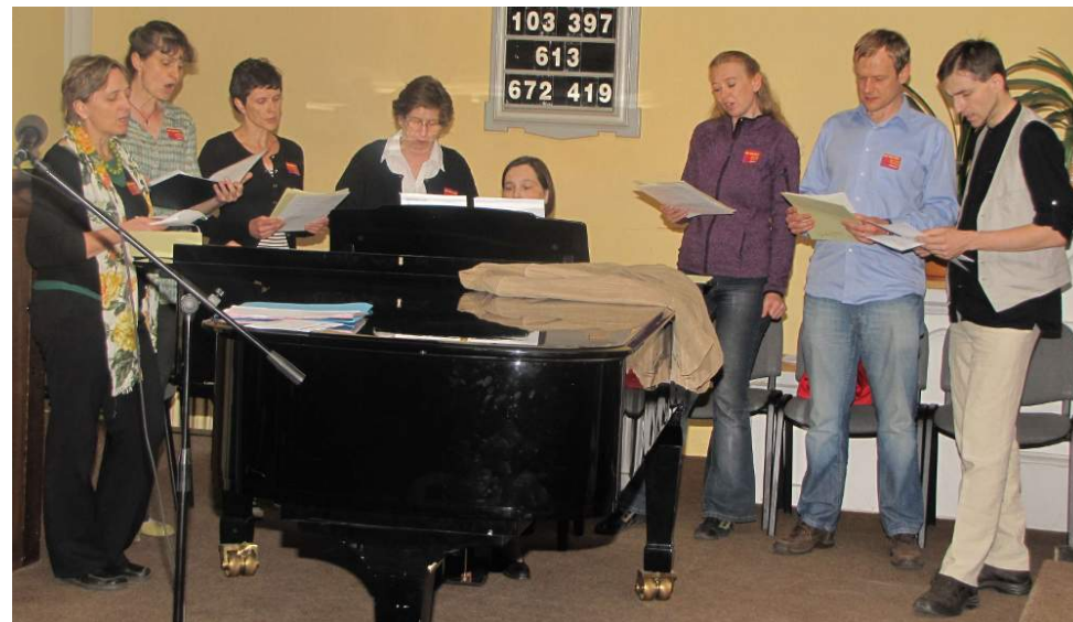
Noc kostelů – zpěváci

Případné změny v programu po uzávěrce Hroznu lze najít na sborových webových stránkách http://vinohrady.evangnet.cz , které jsou pravidelně aktualizovány.