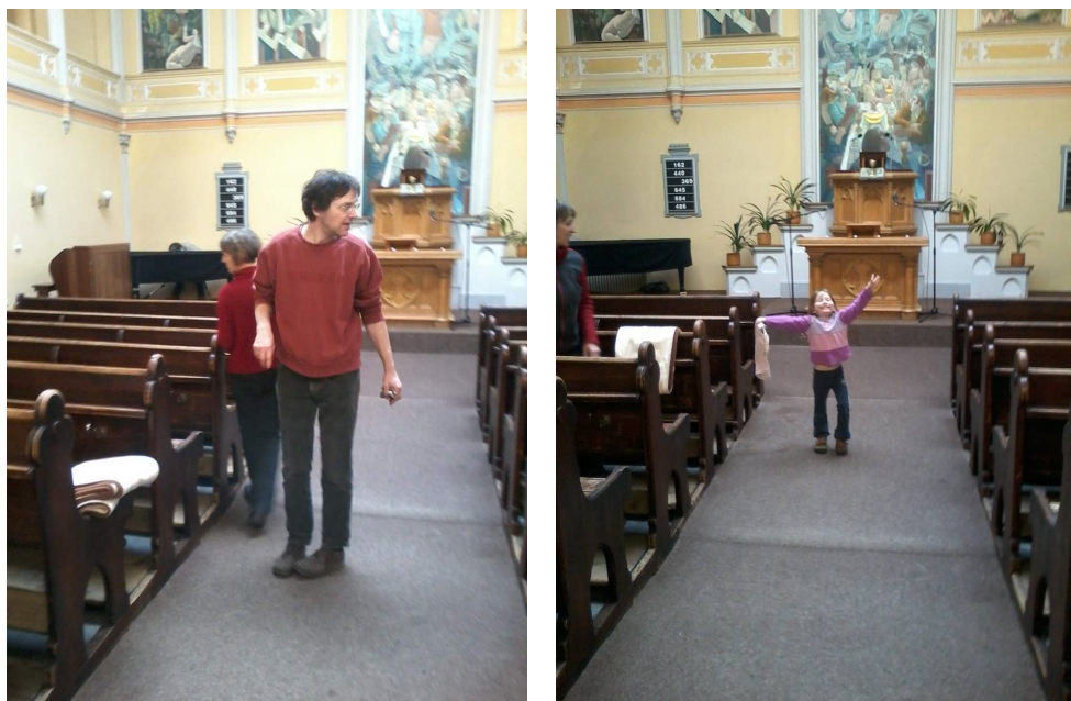
Veselý úklid kostela