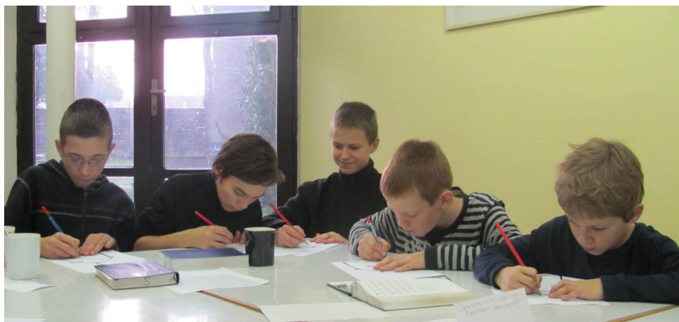
Konfirmandi v Dobříši

Případné změny v programu po uzávěrcce Hroznu lze najít na sborových webových stránkách http://vinohrady.evangelnet.cz , které jsou pravidelně aktualizovány.