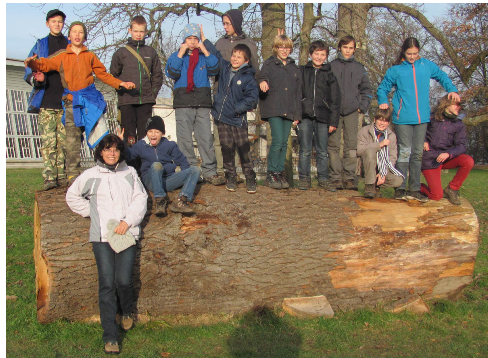
Konfirmandi v Dobříši