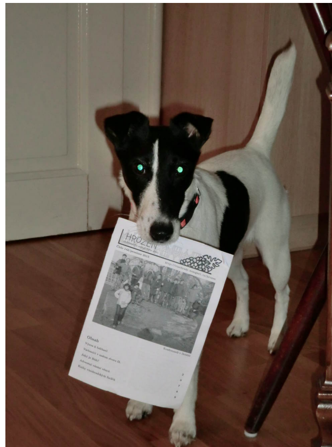
Ochutnávka Hroznu v psím světě

Případné změny v programu po uzávěrce Hroznu lze najít na sborových webových stránkách http://vinohrady.evangnet.cz , které jsou pravidelně aktualizovány.