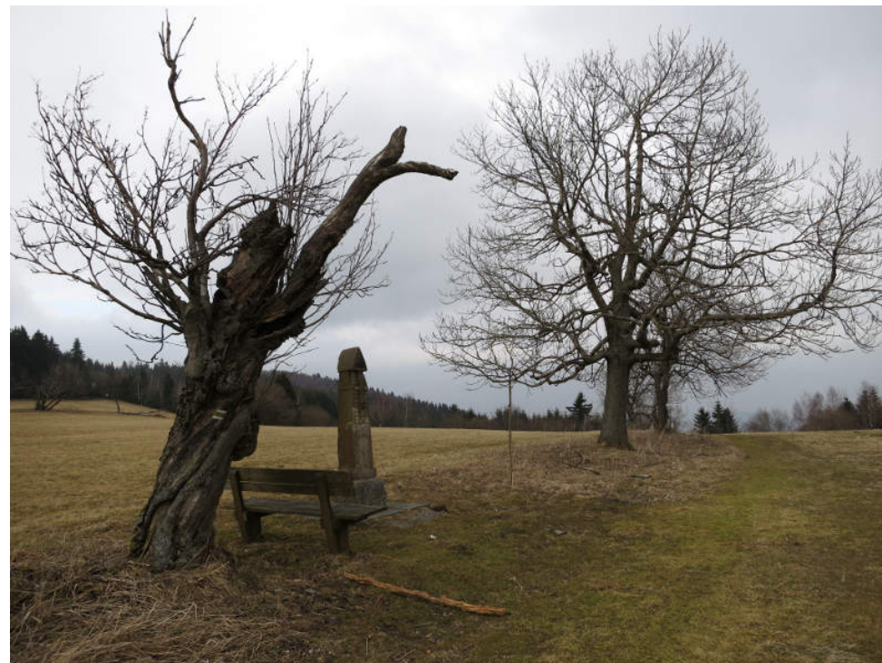
Boží muka nad Albeřicemi