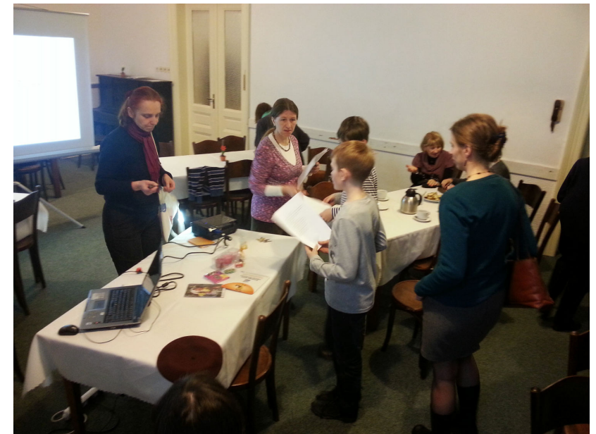
Hra o architektu Turkovi