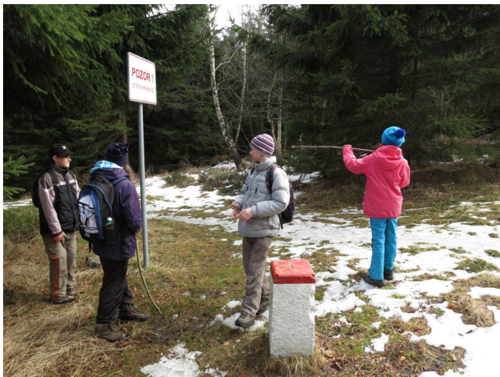
Na hranicích s Polskem