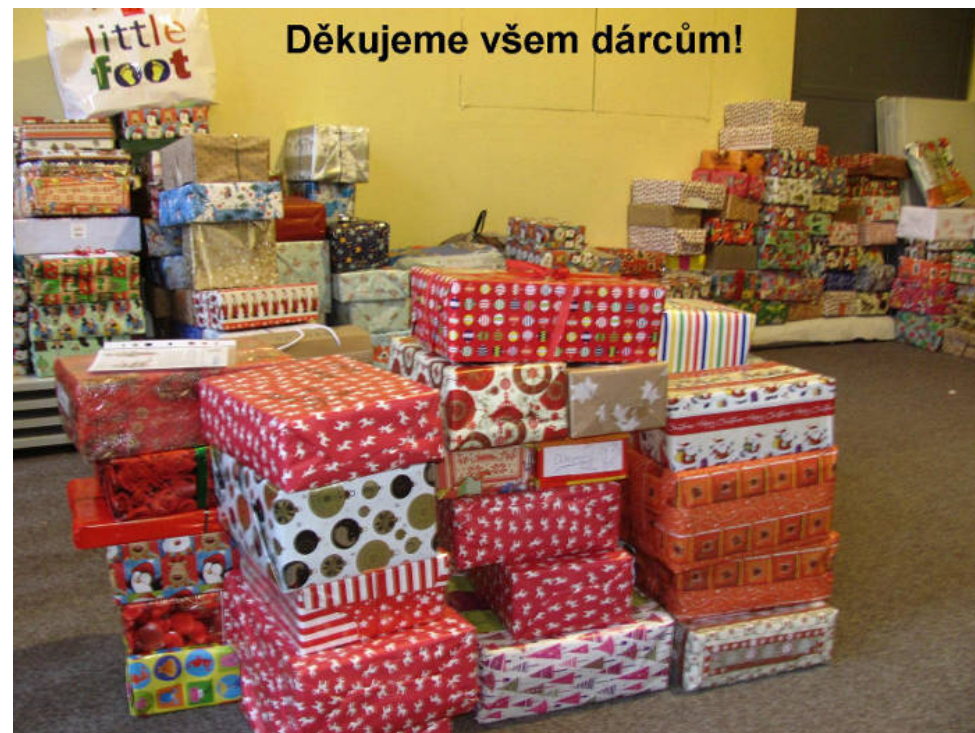
Vánoční dárky dětem z nemajetných rodin