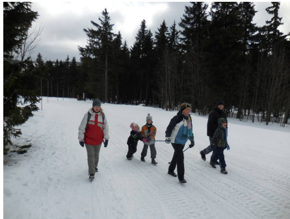
V Janských Lázních