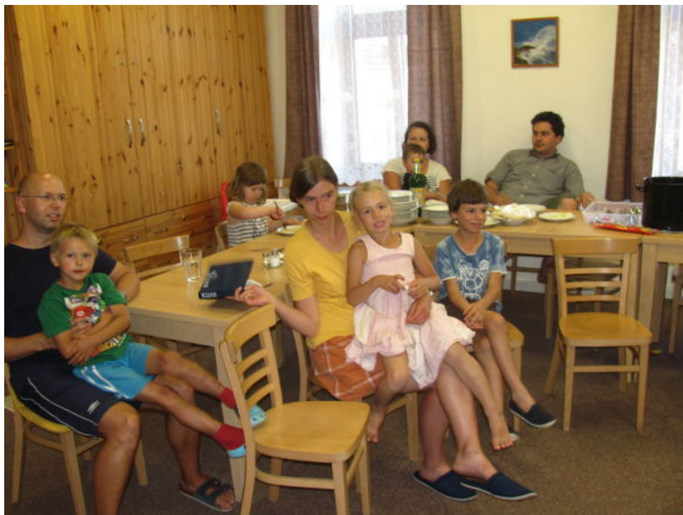
Rodinná dovolená v Kvildě