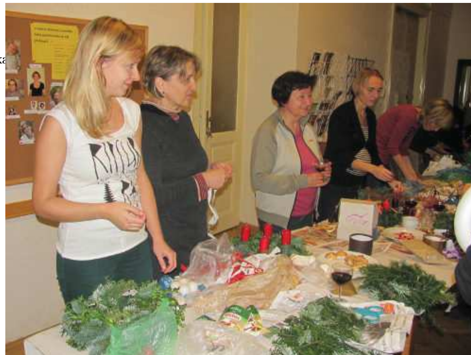
Z loňského vítí adventních věnců