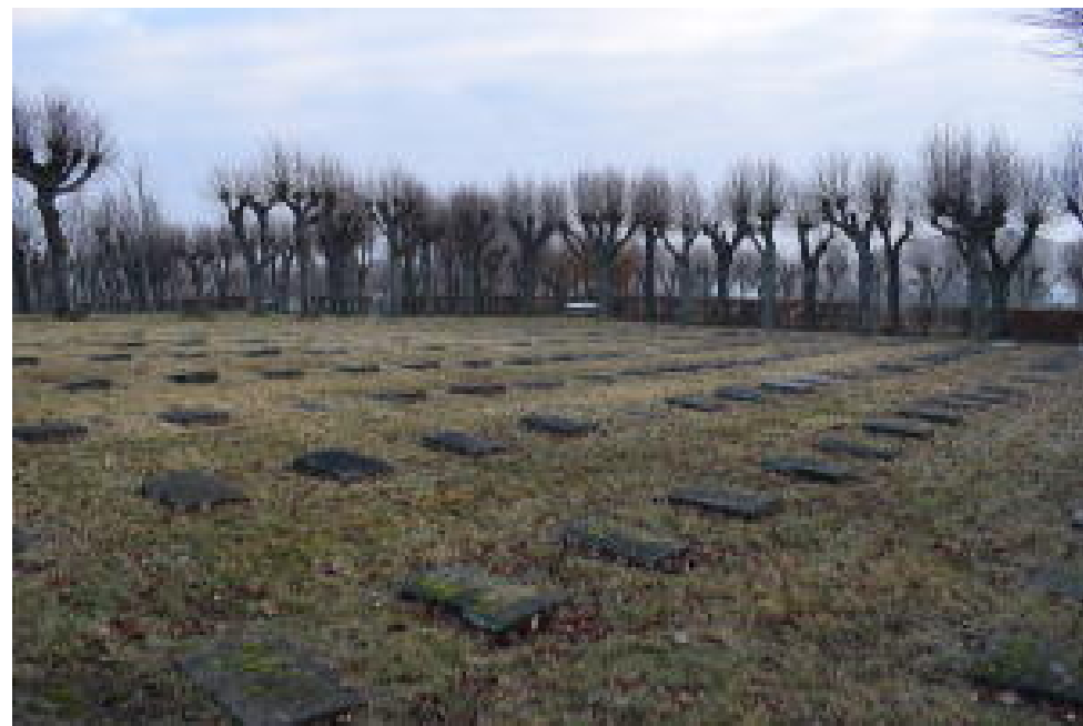
Herrnhut, bratrský hřbitov

Číslo 174/březen 2017 http://vinohrady.evangnet.cz/hrozen