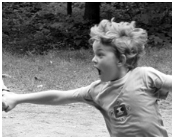
K táboru patří zdravé emoce při hře...