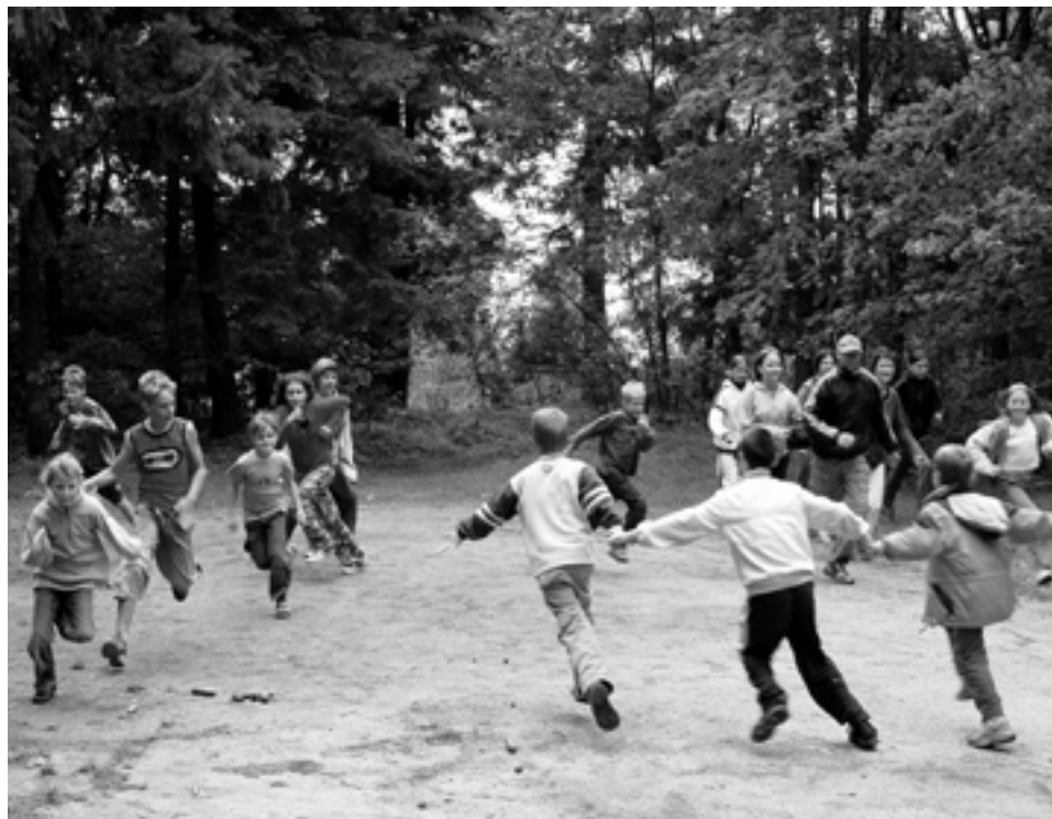
Chyť mě, když to dokážeš! Jako ryby ve vodě se cítili účastníci této hry na rybáře, kteří se snaží o co největší úlovek.