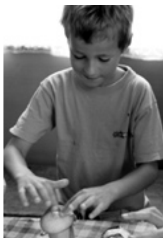
... i pracovní soustředění