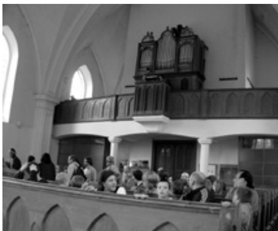
Kostel ve Velké Lhotě před bohoslužbou