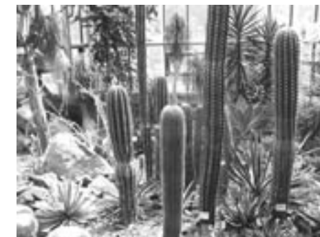
Botanická zahrada v Liberci.

Pak už nás řidič dle přesných, místy až trochu vtíravě neomylných pokynů moudré skříňky zavezl do Frýdlantu, kdysi sídla kontroverzního Albrechta z Valdštejna. Při prohlídce hradu i zámku se bylo na co dívat, děti skoro nezlobily, dospělí se moudře ptali a ještě moudřeji doplňovali průvodce, z oken byl krásný výhled na zamžené lesy a pantofle nám nepůjčili, takže jsme se ani nesklouzli. Pak ještě procházka po parku, pohledy, kávačka, zmrzlina nebo