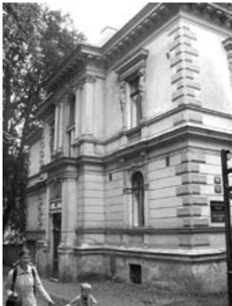
Sborový dům ČCE v Liberci.

ka a poválečný odsun Němců proběhl i zde. Mohli si vzít 30-50 kilo svých věcí. Liberec byl osídlován českými lidmi z vnitrozemí, Slováci, reemigranty z Polska, z Volyně a odjinud. Tato radikální výměna obyvatelstva dávala charakter zdejšímu životu a ten byl jiný než ve vnitrozemí, kde lidé žili