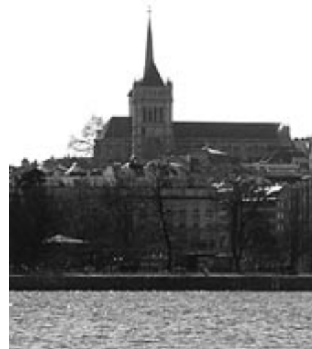
Ženeva, Calvinovo působiště

1) Viditelná církev nebyla pro něj jen nějaká organizace, nýbrž Boží dar a Boží stvoření. Podle Calvina Pán Bůh je při díle v moci Ducha ve viditelné církvi.