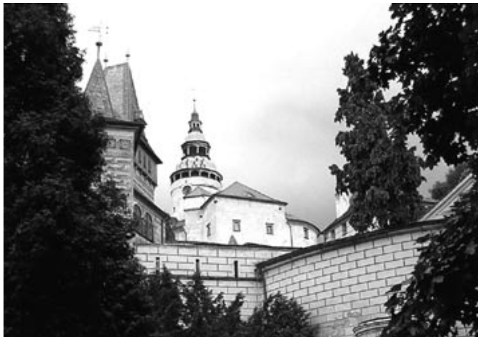
8 | Frýdlantské pamětihodnosti.

Volný čas po bohoslužbách někteří zaplnili procházkou po pozoruhodnostech Liberce, kterou vedl také bratr farář Čapek, jiní se vypravili za bílými tygry a jejich kamarády do místní ZOO, další zas obdivovali rozličnou květenu v krásou vyhlášené liberecké botanické zahradě.