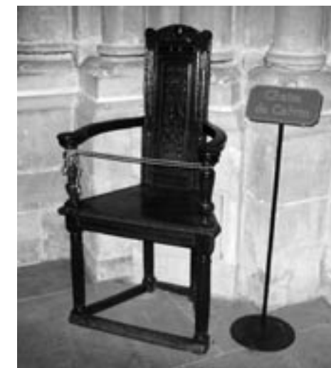
Na této židli Calvin sedával

5) Calvin usiloval o jednotu církve. Známý německý teolog a znalec Luthera Karl Holl uznal, že Calvin se zasazoval o jednotu církve a o jednotu reformace daleko usilovněji než němečtí reformátoři. Jednotě církve nerozuměl ve smyslu uniformity, ale vzájemného uznání, ve smyslu společenství v různosti, jednoty v rozmanitosti.