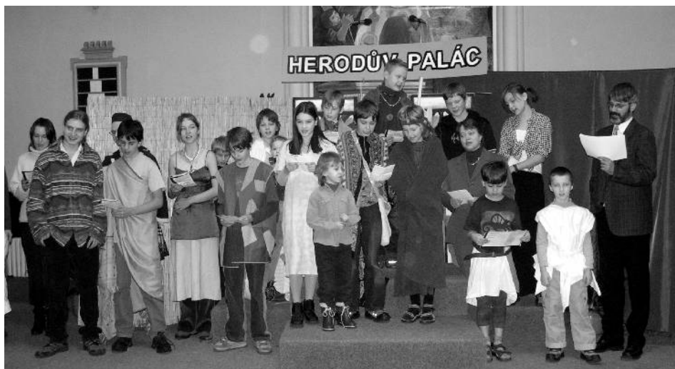
Zpívání v Herodově paláci