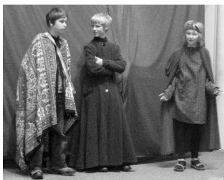
Mudrci hledají Ježíše