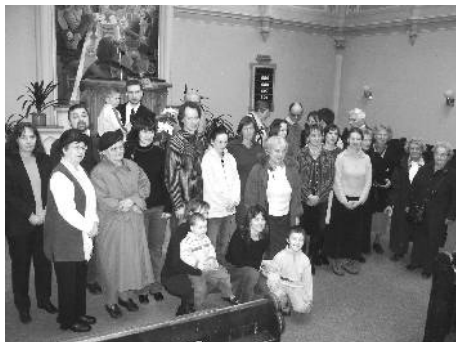
Společné foto „adoptivních rodičů“ z našeho sboru (19.2.2006)

Částka 4 900 Kč ročně na jedno indické dítě se rozděljuje obdobně jako pro děti z Ugandy. Největší položkou je školné. Školní pomůcky, knihy, sešity a uniformy se nakupují ve velkém a dovážejí do vesnic.