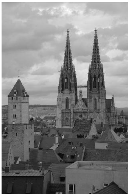
Kostel sv. Petra v Řezně