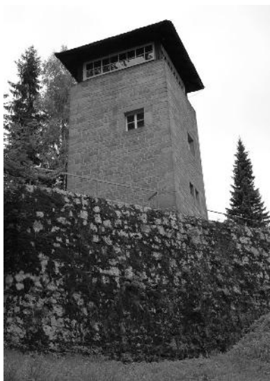
Strážní věž koncentračního tábora Flossenbürg

Autobusem pokračujeme dál do Řezna. Bravurní parkovací manévry našeho pana řidiče na zcela zaplněném parkovišti vzbuzují všeobecný údiv. I autobus pochvalně bručí! První, na co po vystoupení z autobusu narážíme, je nějaký „týpek“, který na nás hned spustil česky něco jako: „Tož já su také Čech“ a „A co tady vlastně kurňa děláte, vždyt' tu nic není, to je jako Praha.“ Nevím, jestli to