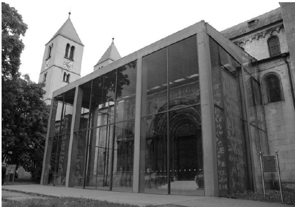
Kostel sv. Jakuba v Řezně