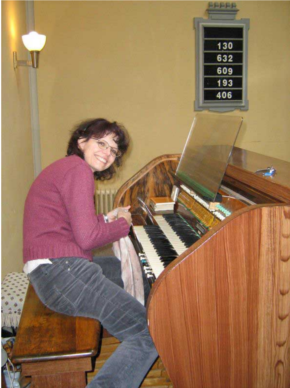
Všestranná sestra farářka u varhan - tentokrát bez taláru, zato s leštěnkou.