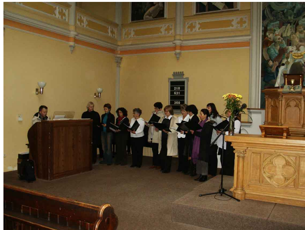
Zpěváci z Wrocławu při zkoušece v kostele 16.11.2008