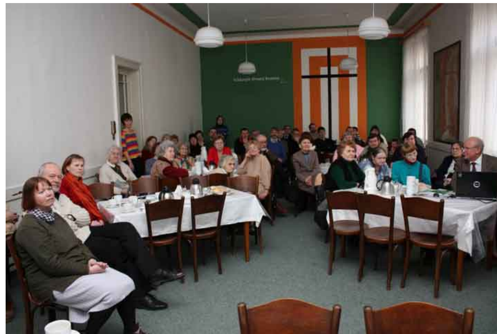
Z poslední sborové neděle