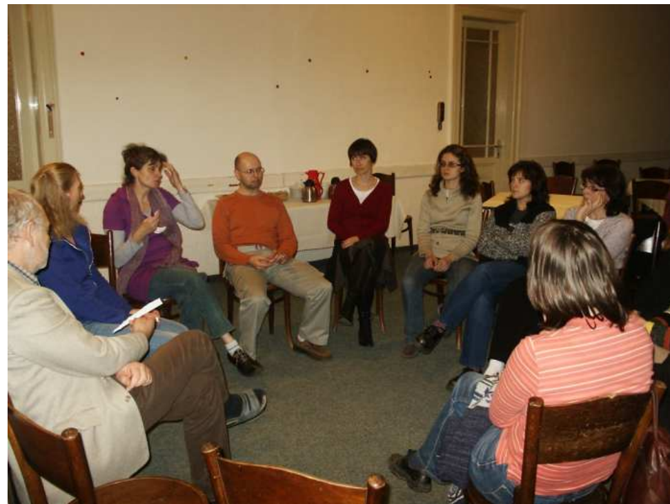
Setkání s učiteli nedělní školy

Případné změny v programu po uzávěrce Hroznu lze najít na sborových webových stránkách http://vinohrady.evangnet.cz , které jsou pravidelně aktualizovány.