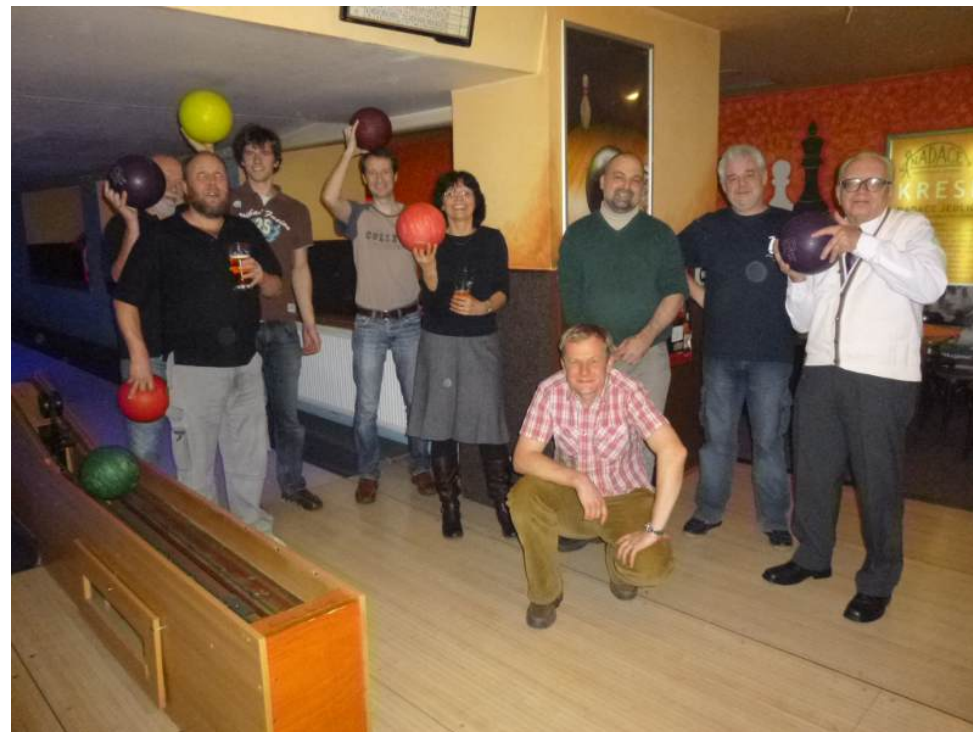
Na „chlapinci“ jsme hráli kuželky