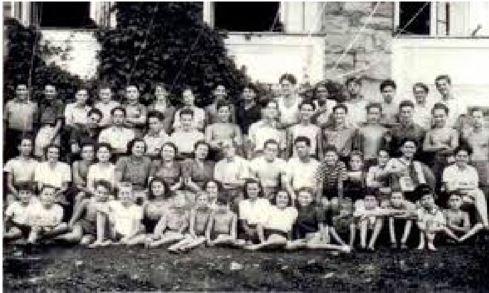
Sirotčinec v Belgické ulici – po válce

snoubenkou Franze Kafky, ovšem zasnoubení bylo před plánovanou svatbou zrušeno.