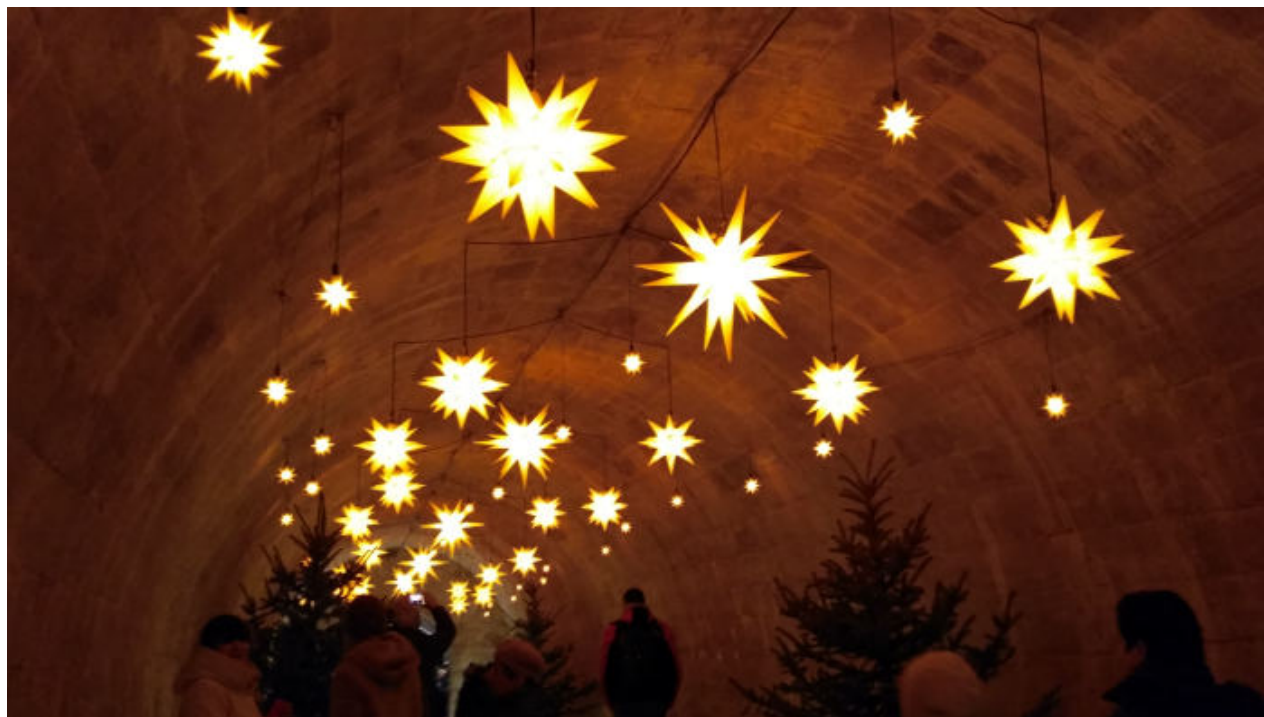
Aj čas vzácný přišel - advent v Königsteinu