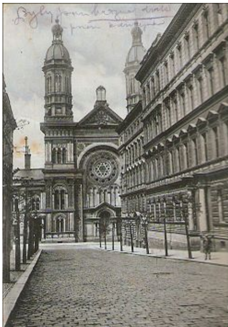
Vinohradská synagoga Vinohrady nabízely ideální pod-

sice už směli odejít, avšak nebylo snadné překonat sociální bariéru a hluboce zakořeněný antisemitismus v domovských městečkách a vesnicích. Naději na důstojný život skýtala anonymita velkých měst, která navíc byla středisky průmyslu a obchodu.