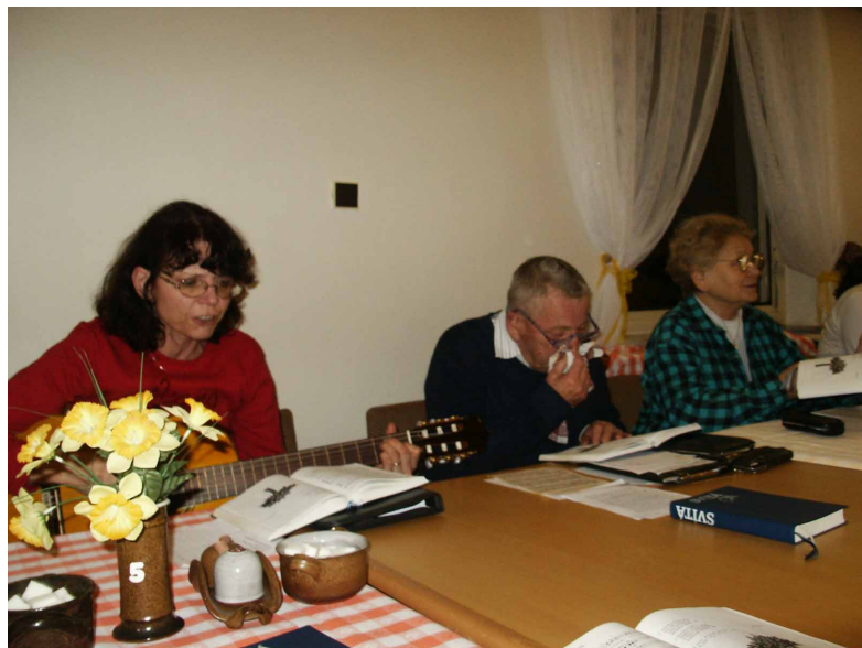
Janské Lázně, 2008