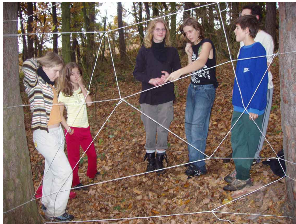
Z jedné akce s mládeží

A jak na to, aby Duch Páně, Duch svobody, nás navštívil a příbytek v nás učinil? Prostě volejme „přijď, Duchu stvořiteli“, do těch slov vkládejme příznání a vyznání, že sami s veškerou svou oduševnělostí nevystačíme a vystačit nechceme, že potřebujeme pro svůj dokonce každodenní život inspiraci, nová vdechnutí Ducha, jenž tvoří a oživuje. Přijď, Duchu svatý, nechceme být korouhvičkou větru doby, chceme se točit po tobě, duchu Ježíše Krista. A vyjdeme poryvům