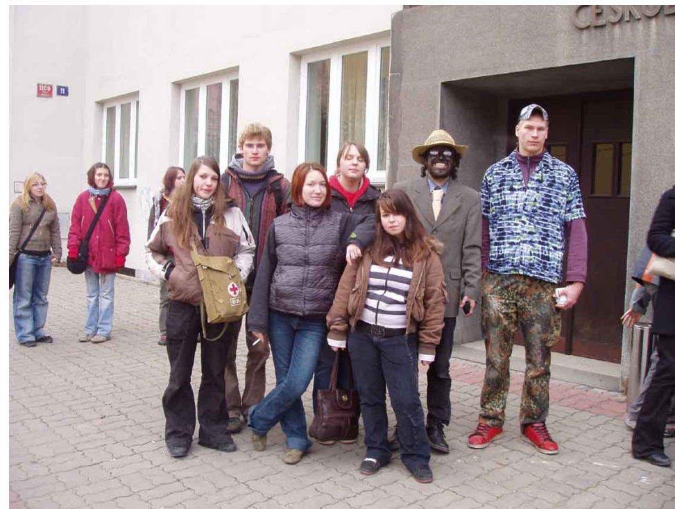
S mládeží Evangelické akademie

Odhaduju to asi na 250 lidí, zdaleka ne všichni však chodí pravidelně někam do mládeže nebo vůbec do církve. Mám pochopitelně také omezenou kapacitu paměti, někdy se lidé ke mně hlásí a já si je nepamatuju. Na různých mládežích je tak kolem 100 – 150 mládežníků, v 31 sborech seniorátu se schází 16 mládeží. Soustřeďím se hodně také na ty mimopražské, Soběhrdy, Benešov, Dobříš.